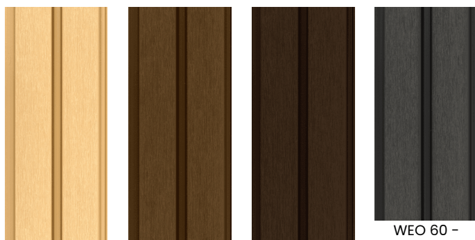
WEO 60 - LAME BARDAGE 33X170MM X 2,9M CEDAR