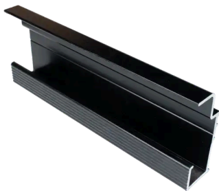
SCHIENEN ALUMINIUM KX-3000 3M (1 STÜCK)