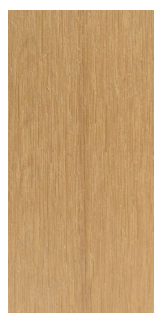
WEO – BRISE SOLEIL OHNE ALU 42X60MM CEDAR