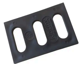
CALE UNTERBRECHUNG WÄRMEBRÜCKE