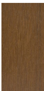
WEO – BRISE SOLEIL OHNE ALU 42X60MM CEDAR