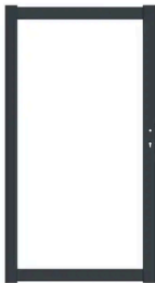
BOSTON - CADRE POUR PORTILLON ALU 980X1830MM