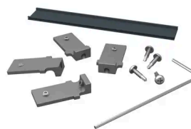
BOSTON - START- EN TOPPROFIEL CONNECTOREN (SET VAN 4)