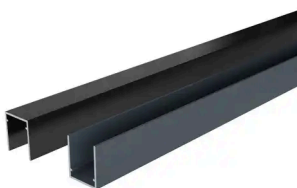
BOSTON - START- EN STOPPROFIEL