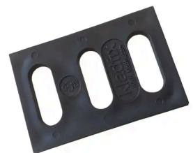
CALE UNTERBRECHUNG WÄRMEBRÜCKE