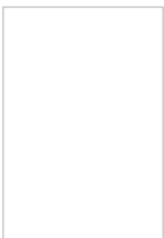
RAIL ALU KX-3000 - NOIR RAL9005