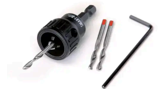
GEREEDSCHAP - COBRA® SMART-BIT