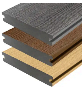
TERRASPLANK - HARMONY 22,5X138MM