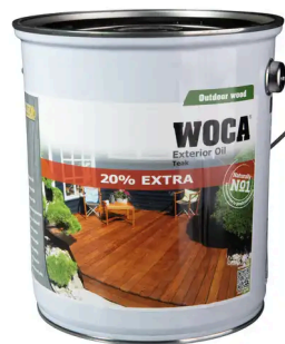
WOCA® ÖL TEAK (2,5L)