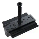
COBRA® HYBRID 7-22 (90 CLIPS + SCHRAUBEN)