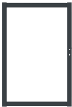
Gris anthracite RAL7016