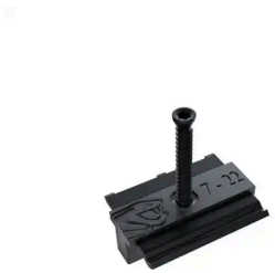
COBRA® HYBRID 7-22 (90 CLIPS + SCHRAUBEN)