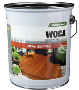
WOCA® ÖL TEAK (2,5L)