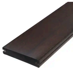
THERMO BAMBUS MELODY 103