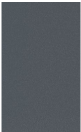
Antraciet grijs RAL7016