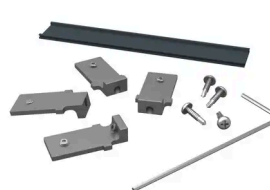
BOSTON - START- EN TOPPROFIEL CONNECTOREN (SET VAN 4)