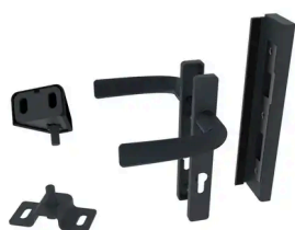
BOSTON - QUINCAILLERIE POUR PORTILLON