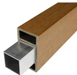
BRISE SOLEIL - VERSTÄRKUNGSLEISTEN 30X30X3900MM