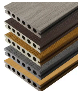
PREMIUM (RHK) 22,5X138MM