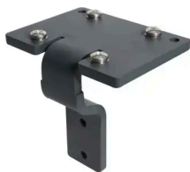
BOSTON - MAUERANKER- ADAPTER