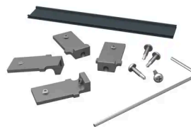
BOSTON - CONNETOREN SET (4)