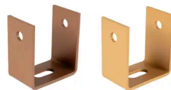
ALUMINIUM U-HALTERUNG (16 ST.)