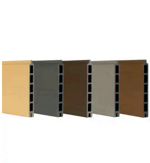
BOSTON - HOUTCOMPOSITIET FENCE BOARD PREMIUM