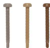
WEO – SCHRAUBEN 4,2X38MM (100 STÜCK)