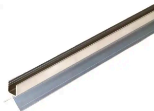
WEO – ALUMINIUM CLICK PROFILE 35X41 MM