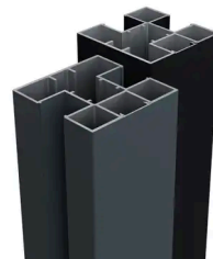
BOSTON - POTEAU ALUMINIUM 75X75MM