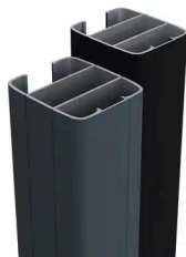
BOSTON - POTEAU ALUMINIUM 60X70MM