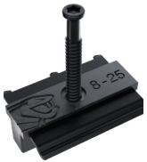
4,8 × 43mm (L)